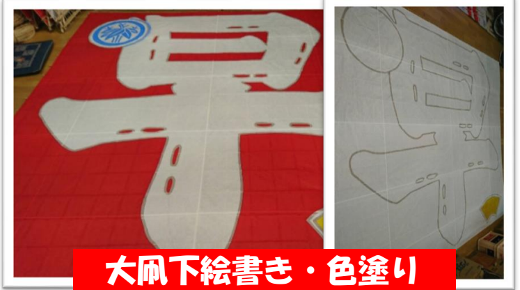
大凧下絵書き・色塗り

左の写真は昨年秋に切り出してきた竹です。曲がりがない良い竹を厳選しました(^O^) 右の写真はロウ引き後と色付け後の大凧です。実物はかなり大きく凧小屋いっぱいになります。10帖凧等は北公民館ホールをお借りして製作するほどです。