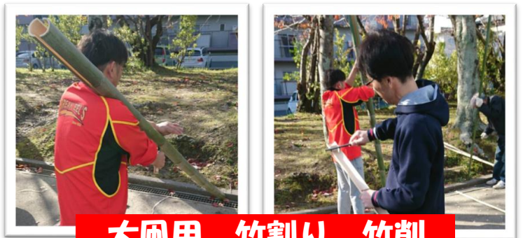
大凧用 竹割り、竹削

平成30年を迎え、大凧作りも本格始動です。 竹割は長さ3m直径8cmに切り出した竹を半分に割り、さらに半分、また半分、その繰返して最終的に3mmの骨組みに仕上げます。その他、親竹、タスキ竹、尾竹等を付けて大凧の骨組みの完成となります。 その後、下絵書き→ロウ引き→染料で色塗りして大凧が完成します。