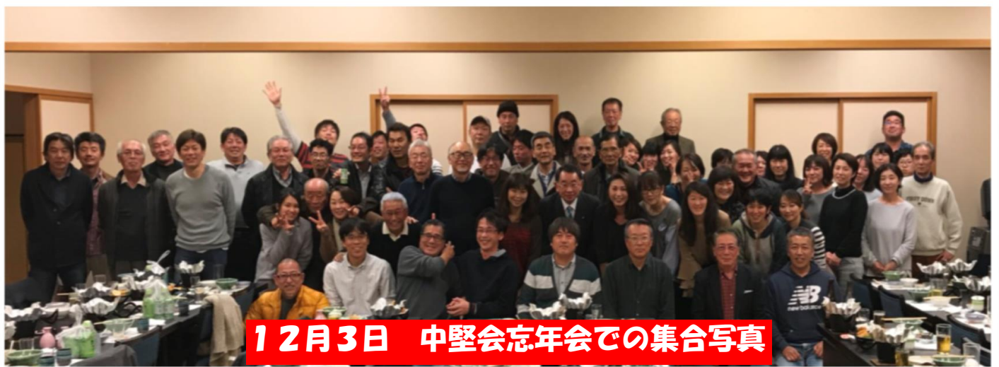
12月3日 中堅会忘年会での集合写真

平成29年12月3日、毎年恒例の中堅会忘年会が司料理店にて行われました。 当日は自治会、子供会、屋台管理委員会他の方々もお越しいただき楽しく交流できました。